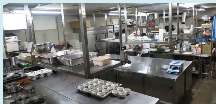
↑ 厨房の様子。会席料理(夕食)の準備中。 ← 多くのホシザキ什器が活躍(スチームコンベクション等)