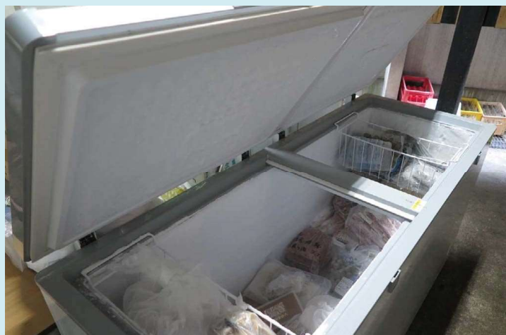
600Lストッカーの設置状況。左扉側は主に下処理済の魚類、右側は肉類。カゴには朝食食材を保管。